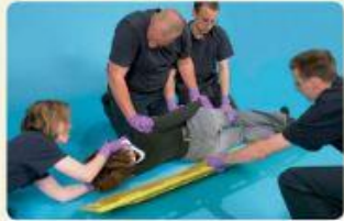
Step 3 The fourth rescuer slides the backboard toward the patient.