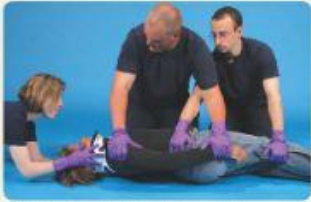
Step 2 Roll the patient onto his or her side.