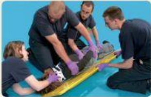
Step 4 Roll the patient onto the backboard.